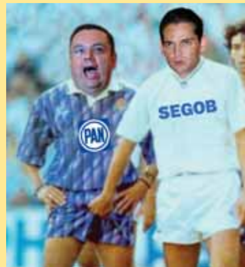
Que a Germán Martínez, líder nacional del PAN le jalaron las... orejas por los malos resultados que ha tenido el partido durante su presidencia y tal parece que sí le dolió.