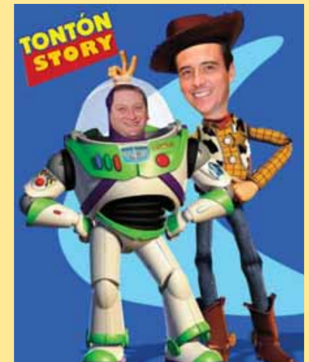
No se pierda las nuevas aventuras de Tontón Story, estelarizadas por Goody Fernández y Bailleres Lightyear. Trabajan mucho para no resolver nada.