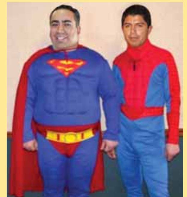
Qué le parecen estos superéroes, región 4, que han salido a la defensa de Cuatli, aunque así como van las cosas, es más fácil que él los hunda a que ellos lo salven.