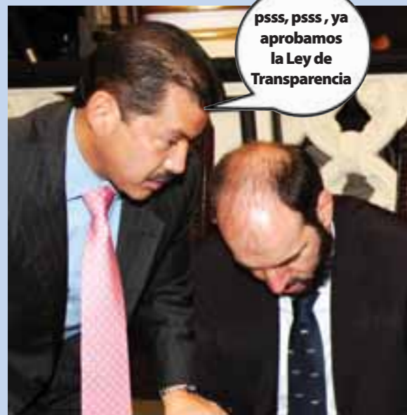
Y cuando despertaron... todo ya estaba aprobado