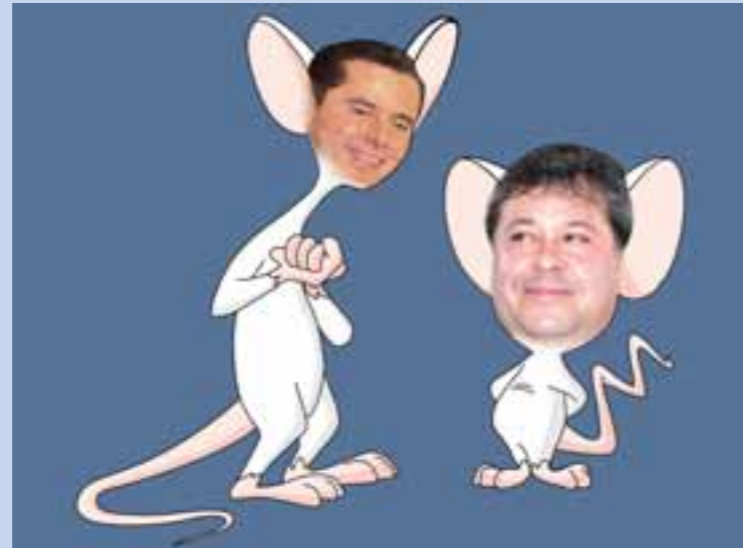
En todo gobierno nunca faltan estos tipos. Sí, aquellos que sueñan con dominar al mundo, que buscan reflectores y sólo causan problemas. Este es el caso de Ratón Lazcano y de Juan de Roedor Bravo