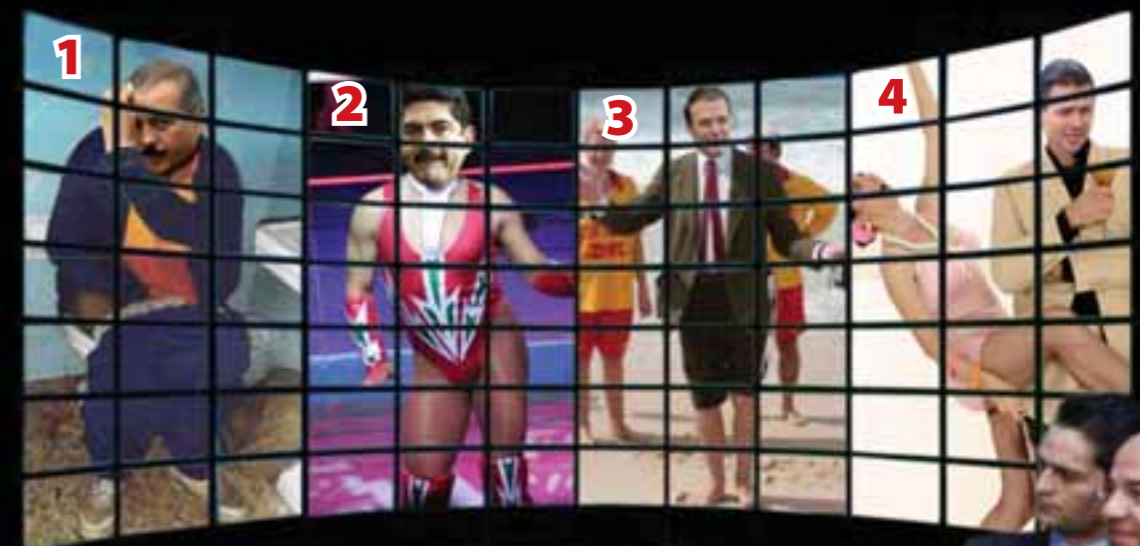
Como una exclusiva de Mundo Bizarro presentamos la "habitación secreta", en esta sala se realiza el espionaje de algunos personajes políticos, aunque para ser sinceros hasta ahora no revelan nada nuevo. Pantalla 1: Beltrones sufrió una fuerte diarrea después de que supo que lo vigilaban. Pantalla 2: Espino, como el luchador que es, claro exótico. Pantalla 3: Ebrard inaugurando playas en el DF. Pantalla 4: Peña Nieto haciendo castings a las aspirantes a primera dama.