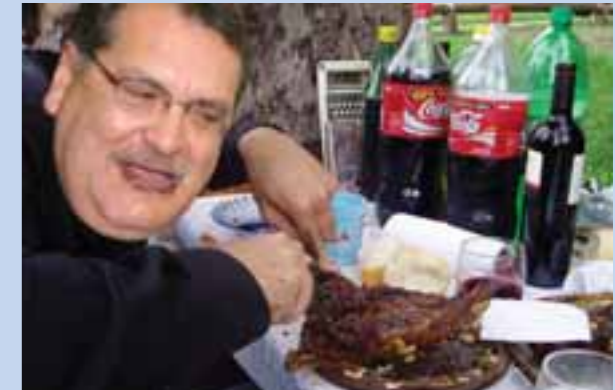
El contralor estatal asistió, hace unos días, al cumpleaños del gobernador y era tal su hambre que no vio las unidades del gobierno que se encontraban en el lugar, ni escuchó a la sinfónica del estado que amenizó la fiesta. Buen provecho a nuestro incapacitado funcionario.